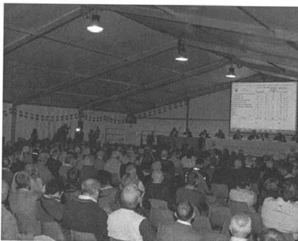
Sopra: Assemblea dei Delegati 2012. A destra: Una delle spedizioni vincitrici del Premio Paolo Consiglio.