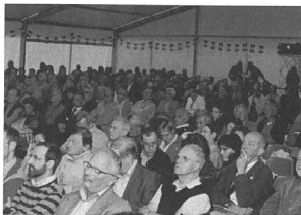
Assemblea dei Delegati 2012.

Dalla Libera (Sezione di Vicenza) In qualità di presidente della Commissione Nazionale Scuole di Alpinismo e Scialpinismo (OTCO CNSASA) saluta i Delegati ed interviene in merito al progetto di riordino degli Organi tecnici centrali, approvato dal Comitato Centrale di indirizzo e di controllo (CC), che si sta realizzando a livello centrale e regionale. Al riguardo, segnala il forte disagio del comparto CNSASA ed auspica lo sviluppo di un dialogo costruttivo sull'argomento. La CNSASA ha in più occasioni evidenziato che applicare alla propria struttura il riordino così come approvato comporterebbe delle forti limitazioni all'operatività delle Scuole ed un drastico peggioramento della qualità della formazione degli Istruttori e dei corsi sezionali. Nell'approvare il progetto di riordino, a parere della CNSASA, il CC non ha valutato adeguatamente alcuni aspetti importanti, che per la CNSASA rappresentano delle priorità. Il primo aspetto non considerato è il cambiamento sociale che sta rendendo sempre più pressante la richiesta di una frequentazione della montagna in sicurezza. Rispetto al passato, l'attuale società vuole protezione dai rischi e rassicurazioni in tutti i settori di attività, compreso l'alpinismo, non più considerato un'oasi solitaria ma un'attività accessibile ai