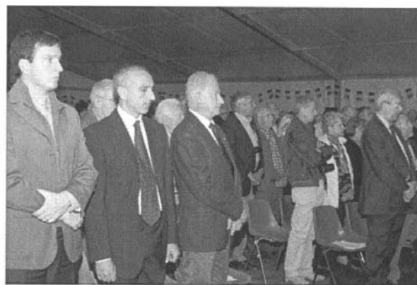
I delegati osservano un minuto di silenzio per le vittime del terremoto.

Per correggere tale errore e restituire le risorse necessarie alle attività di soccorso, il GAM ha presentato un Ordine del giorno, già accolto dal Governo, che auspica possa portare ad un rapido e positivo risultato. Un secondo ambito su cui il GAM ha agito è quello dei rifugi alpini: con la sottoscrizione di un recente decreto attuativo, le risorse negli scorsi anni stanziare per incentivare il rinnovo dei generatori di energia elettrica nei rifugi di montagna sono finalmente divenute realmente disponibili. Al milione di Euro così messo a disposizione potrebbero sommarsi per le medesime