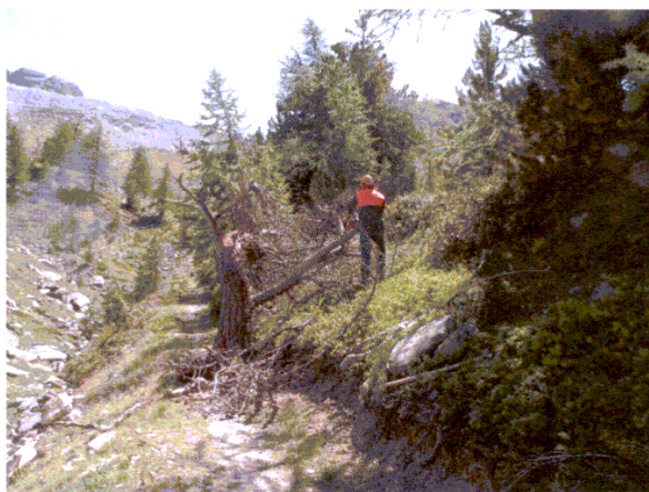
Guarda parco al lavoro per rendere transitabile un sentiero

sono da ricordare in Piemonte la realizzazione dell' itinerario finanziato dal PSR itinerario