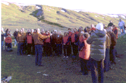
L'Alborada al Colle del Nivolet

L'iniziativa, roposta dalla biblioteca di Valsavarenche, ha previsto un ricco programma di appuntamenti, convegni, escursioni e spettacoli, sul tema della biodiversità, del benessere e della natura. Nell'ambito della manifestazione si è tenuta una serata tenuta dal Parco, dal titolo "Dalla sua storia alla sua biodiversità"