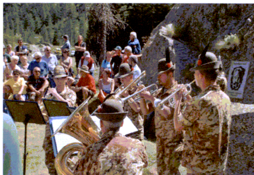
L'inaugurazione dell'Oasi dedicata allo scrittore "Rigoni Stern"