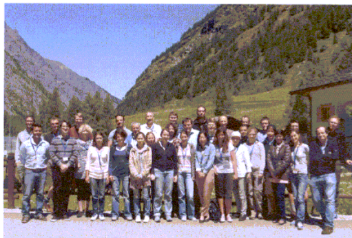
I partecipanti alla Summer School di Valsavarenche

□ Summer school: incentrata sul tema "Climate, Aerosols and the Cryosphere", si è tenuta per l'ottavo anno consecutivo a Dégioz, dal 20 al 28 Giugno 2012, organizzata dall'Istituto di Scienze dell'Atmosfera e del Clima (ISAC) del CNR di Torino, insieme al Laboratorio di Meteorologia Dinamica dell'École Normale Supérieure di Parigi, con il supporto del Comune di Valsavarenche e del Parco Nazionale Gran Paradiso; 45 i ricercatori ed esperti provenienti da diverse nazioni, India, Giappone, Stati Uniti, oltre a numerosi italiani ed europei. Gli studiosi hanno preso parte ad un impegnativo programma di lezioni di nove giorni, con interventi di docenti provenienti da importanti università ed istituti di ricerca di livello mondiale.