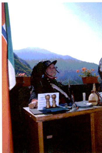
Una immagine di “Una valle fantastica” Anno 2011