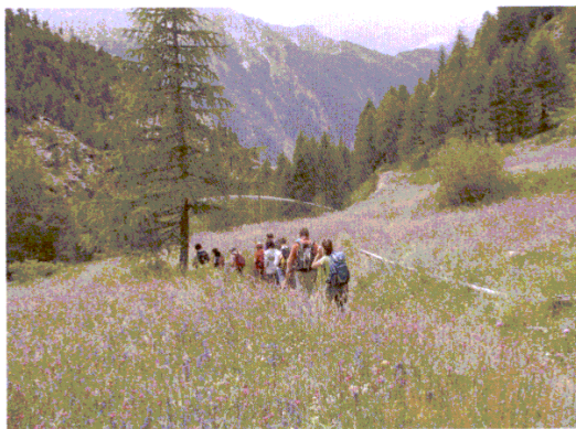
Floralpe: giardinaggio alla scoperta della flora d'alta quota

□ 300 partecipanti alle iniziative previste a Piamprato