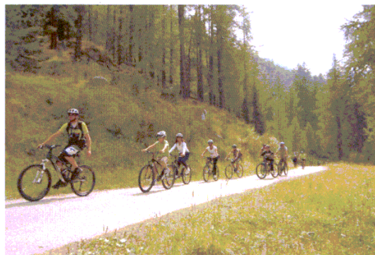
Bikesharing e manifestazioni di cicloturismo: un buon connubio