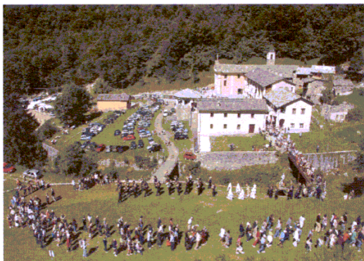
La processione del Santuario di Prascondù

un piatto tipico del territorio. Nel corso della manifestazione è avvenuta la premiazione, sono stati presentati i lavori di recupero del Santuario e si è tenuta una tavola rotonda sul tema del turismo religioso.