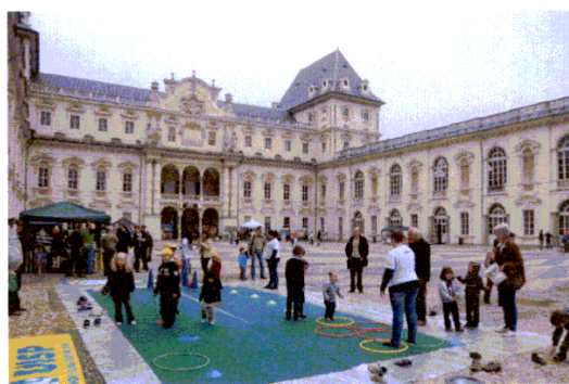
L'evento inaugurale al Castello del Valentino

2. Enogastronomia (a cura degli operatori aderenti al Marchio di Qualità Gran Paradiso: degustazioni proposte dagli operatori enogastronomici);