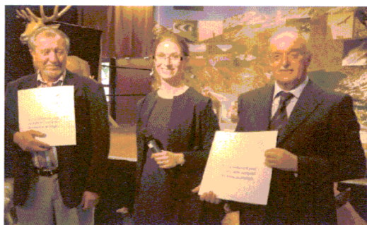
L'attribuzione del Diploma Europeo congiunto

E' stato celebrato il rinnovo congiunto di questo prestigioso riconoscimento ai due Parchi,