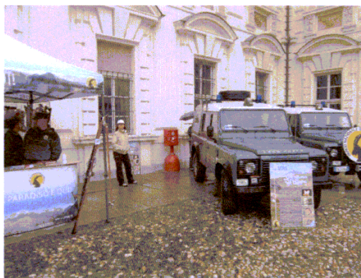
Il Parco va in città al Valentino

Le numerose attività di comunicazione che ogni anno l'Ente Parco organizza nell'adempimento dei ruoli istituzionali di "promozione di attività di educazione, di formazione e di ricerca scientifica, anche interdisciplinare, nonché di attività ricreative compatibili" (art.2 c.3 lett. c) della L.394/91) quest'anno hanno preso spunto dalla ricorrenza del 90° dall'istituzione del Gran Paradiso, primo Parco Nazionale ad essere creato in Italia. Lo slogan "la nostra storia è il vostro futuro" ha costituito occasione per tracciare il percorso evolutivo con cui l'area protetta ha trasformato il suo approccio da ente di mera tutela a partner attivo per gli operatori e le amministrazioni locali che intendono abbracciare gli stessi obiettivi di valorizzazione sostenibile del territorio, inteso nel senso più lato (natura, cultura, tradizioni, mestieri, ...). L'immagine che si voleva offrire era quella di un Parco che guarda al futuro, che punta ai giovani ed esprime il suo dinamismo.