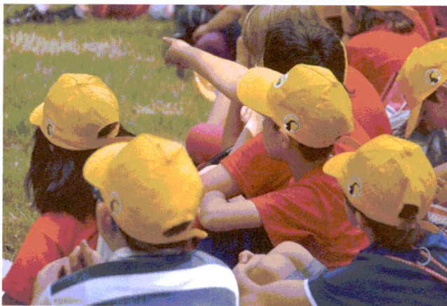
I bimbi del progetto "Buon compleanno Parco"

Regione, sono state formate guide che hanno poi realizzato attività didattiche nei vari parchi, utilizzando un apposito kit messo a disposizione dalla Regione. Attraverso interventi in classe e uscite nel Parco Gran Paradiso, il progetto ha permesso alle scuole di avvicinarsi alla natura da un punto di vista diverso, attraverso la conoscenza degli alleati naturali che l'uomo ha a disposizione per gestire l'ambiente naturale e agricolo-pastorale.