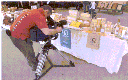
Le riprese della Rai per "Montagne"