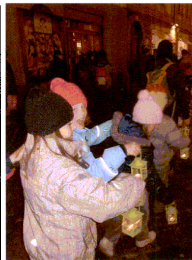
I bambini disegnano i 90 anni