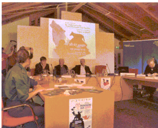
L'apertura di “Lupus in fabula”