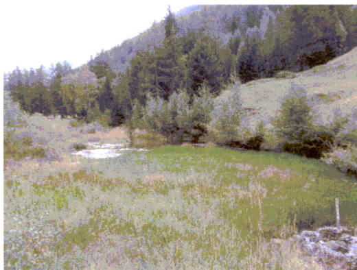
L'area di stagno di "Les fontaines" di Cogne

del progetto "Giroparchi" , messo a punto con Regione Valle d'Aosta e Fondation Grand Paradis si è dovuto rinunciare, a seguito della totale indisponibilità del gestore dell'alpeggio su cui insiste l'area umida di Prà Suppiaz, pur in presenza di un'area SIC e di un intervento che si considerava come una valorizzazione del territorio e dell'attività agricola, alla prosecuzione della progettazione del percorso natura nell'area di torbiera a Carici e a sfagni. Con la collaborazione dell'amministrazione comunale è stato individuato un altro itinerario in località Les Fontaines che presenta delle interessanti zone a stagno attorno al quale possono essere illustrati diversi specie floristiche ed animali ed i relativi ecosistemi .