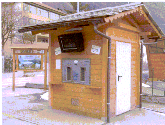
Il punto di erogazione dell'acqua del Parco a Locana

dedicati a disabili ed anziani che riguardano la creazione di percorsi fruibili sul girologo di Ceresole e sul tracciato che dal centro visitatori del Parco in località Chanavey porta al capoluogo di Rhêmes-Notre-Dame. La riduzione degli impatti paesaggistici è alla base dell'azione "Meno tralicci nel Parco"; Valprato Soana e Cogne hanno ottenuto il contributo con due significativi progetti di interrimento di linee aeree a Campiglia Soana e a Valnontey. Nell'ambito dell'azione "Buone pratiche nel recupero del patrimonio edilizio del Parco", l'intervento del comune di Noasca riguarderà il recupero di un fabbricato in borgata Varda, sul progetto di albergo diffuso, mentre a Ronco Canavesano interesserà un immobile nel vallone di Forzo, in borgata Tressi, dedicato ad