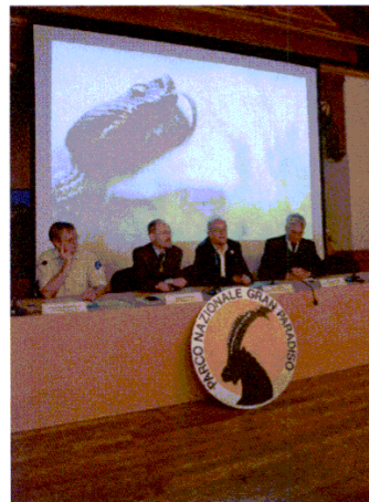
Presentazione concorso "Fotografare il parco"

□ 70 partecipanti alla cena di inaugurazione del Grand Hotel.