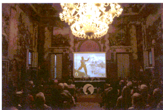
Un momento di celebrazione istituzionale

La corte del Castello, così suddivisa, è stata il palcoscenico di numerose attività che, nel corso di tutta la giornata, hanno coinvolto attivamente il pubblico. Un programma ricco di attività per tutti che si è andato ad integrarsi con lo spazio interno, destinato invece agli aspetti più propriamente scientifici, istituzionali e politici. Nella sala d'ingresso al castello, infatti, è stata allestita una proiezione di immagini storiche e contemporanee del parco, come anticamera al Salone d'Onore (al primo piano), destinato invece agli incontri e alle presentazioni del pomeriggio: