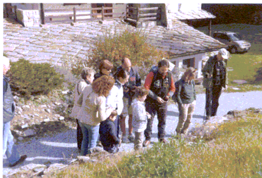
Escursione guidata per "Armonie di note, suoni e sapori"

Il Convegno nazionale dell'Associazione Italiana Guide Ambientali ed Escursionistiche, in occasione dei festeggiamenti si è tenuta a Ceresole Reale, sul territorio del Parco. E' stata