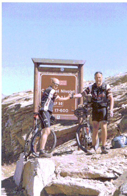
La soddisfazione di aver raggiunto il colle del Nivolet con la bicicletta