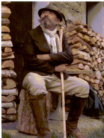
Sua Maestà Re Vittorio Emanuele II in "Noasca da Re"