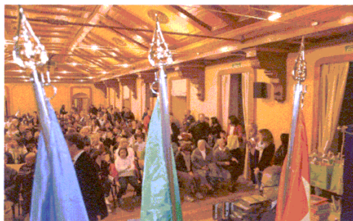
La grande partecipazione a "Ho un amico nel Parco"