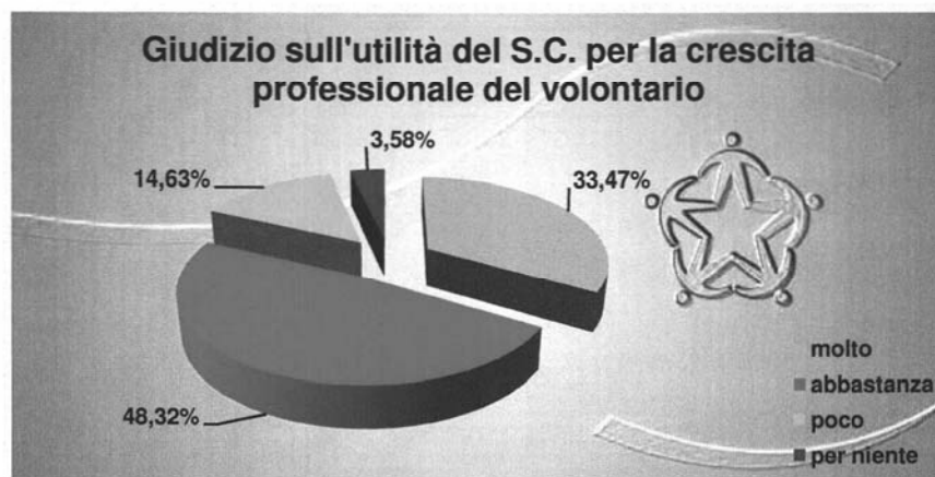
Graf. 57 Giudizio sull'utilità del servizio civile per la crescita professionale del volontario

La riprova è data dall'alto livello del giudizio di soddisfazione espresso in relazione all'esperienza vissuta, laddove oltre il 92% dei volontari la ritiene molto (52%) o abbastanza (40%) soddisfacente (Graf. 58).