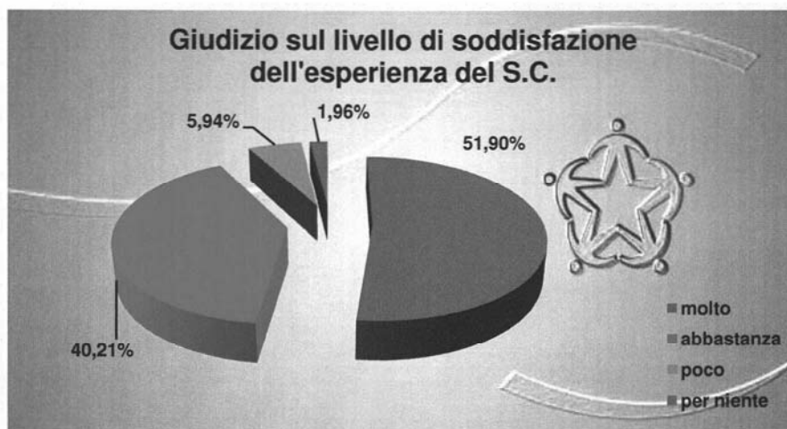
Graf. 58 Giudizio sul livello di soddisfazione dell'esperienza del servizio civile

Rispetto a quanto specificato riguardo alla componente soggettiva (43,5%), il restante 56,5% dei volontari ritiene che l'utilità maggiore del servizio sia verso soggetti terzi, che rappresenta la componente solidaristica del servizio. Il dato è in linea con quello posto alla base della motivazione della scelta di effettuare