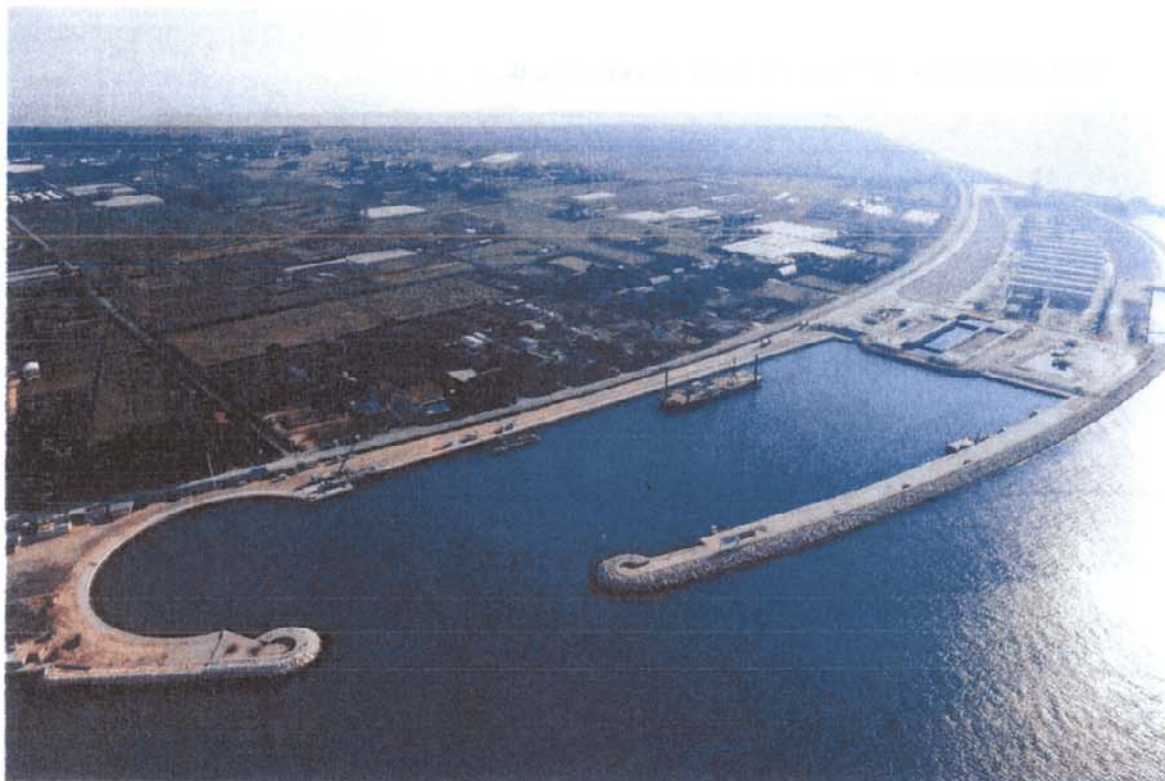
Bocca di Lido - Treporti: in primo piano, il bacino lato laguna, mentre in alto quello lato mare messo all'asciutto per essere utilizzato come tura per la prefabbricazione dei cassoni, sui quali verranno incernierate le paratoie della barriera di Treporti