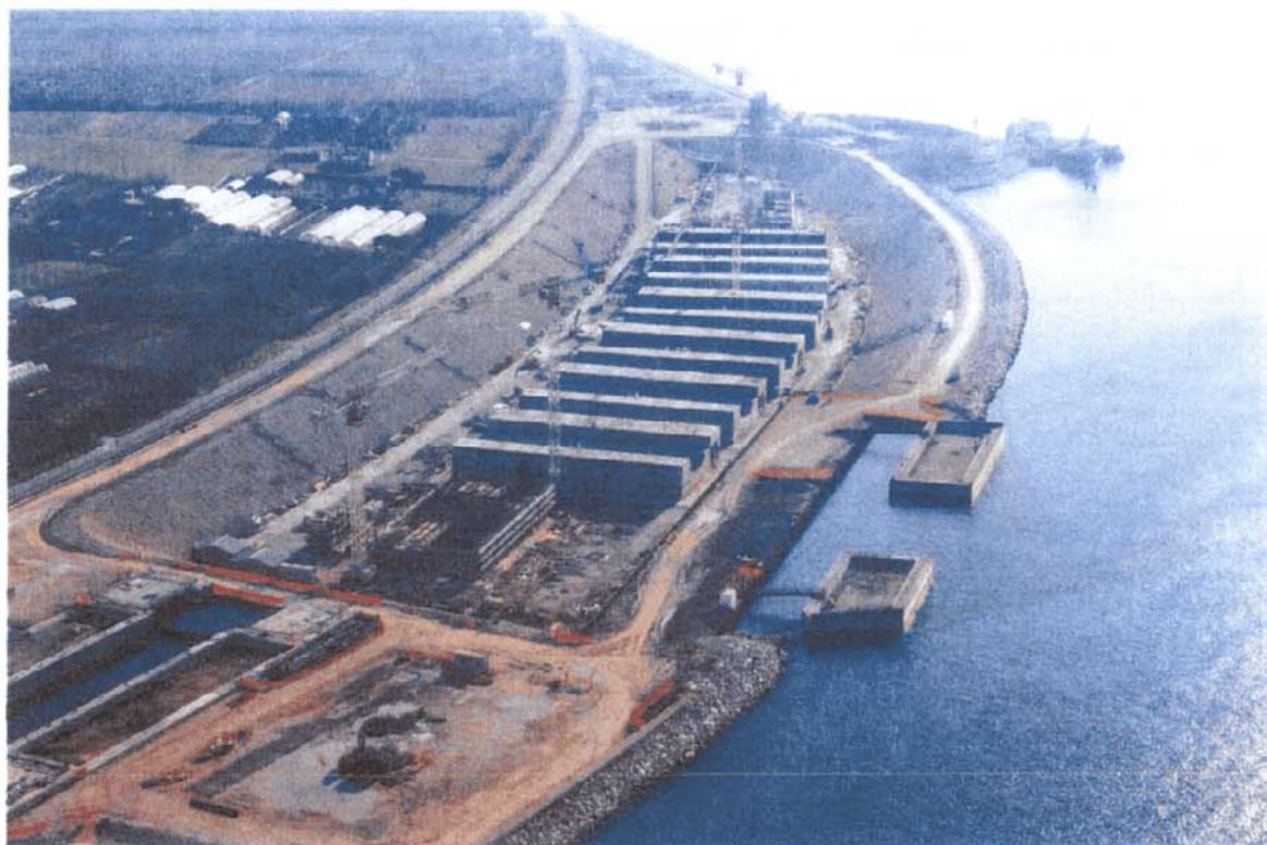
Bocca di Lido - Treporti: in primo piano, il bacino lato mare messo all'asciutto per essere utilizzato come tura per la prefabbricazione dei cassoni sui quali verranno incernierate le paratoie della barriera di Treporti