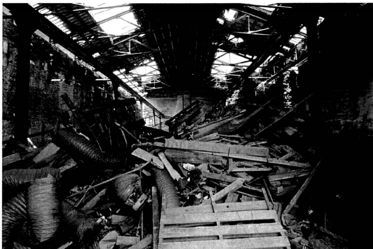
Una delle Tese della Novissima prima degli interventi