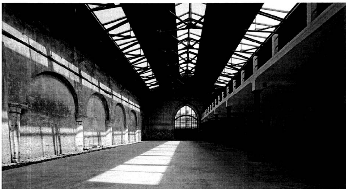
Una delle Tese della Novissima a lavori ultimati