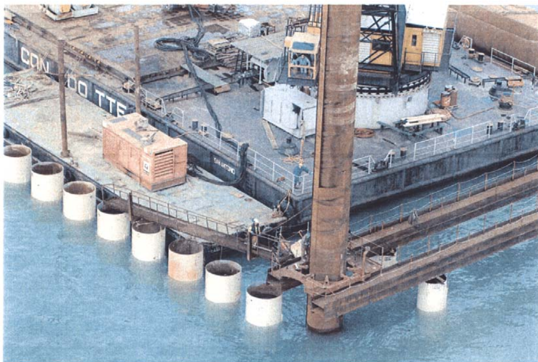
Bocca di Malamocco : particolare della fase di infissione dei palancolati in corrispondenza della spalla sud.