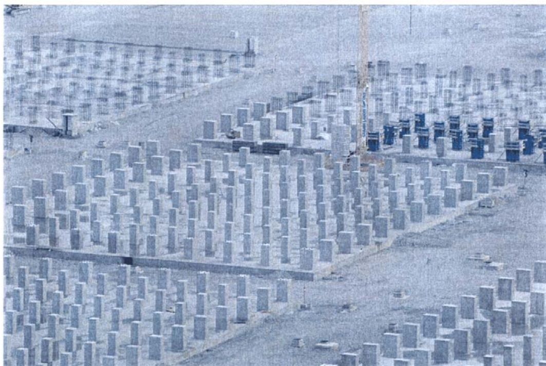
Bocca di Malamocco: particolare delle lavorazioni di realizzazione delle piastre di appoggio per la prefabbricazione dei cassoni di alloggiamento delle paratoie della barriera di S. Nicolò. In evidenza i pilastri di appoggio dei futuri cassoni.