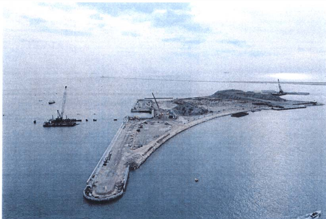
Bocca di Lido - Treporti: l'isola nuova dal lato che costituirà la spalla ovest della barriera di Treporti.