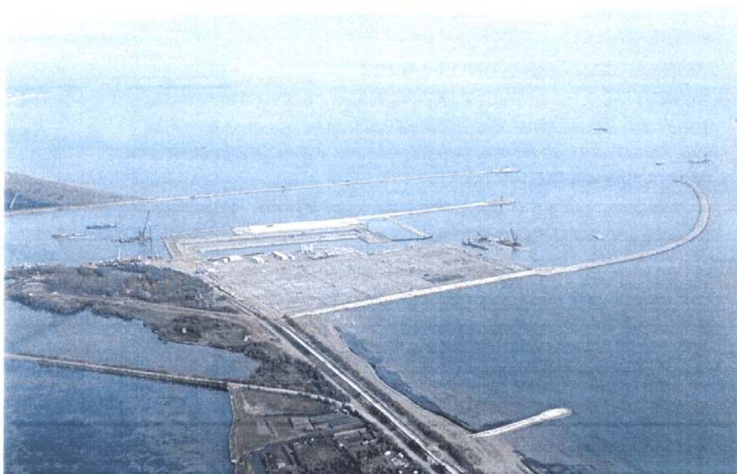
Bocca di Malamocco: veduta d'insieme delle lavorazioni in corso. Dal basso verso l'alto il rilevato provvisorio con le plastre per la prefabbricazione dei cassoni, la conca di navigazione e le opere di spalla sud con il terrapieno e la vasca per gli impianti di barriera.