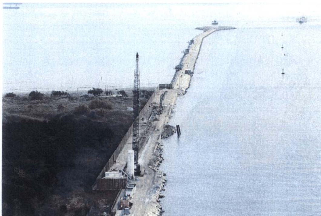
Bocca di Malamocco: particolare del lato Alberoni con le lavorazioni per la spalla nord.