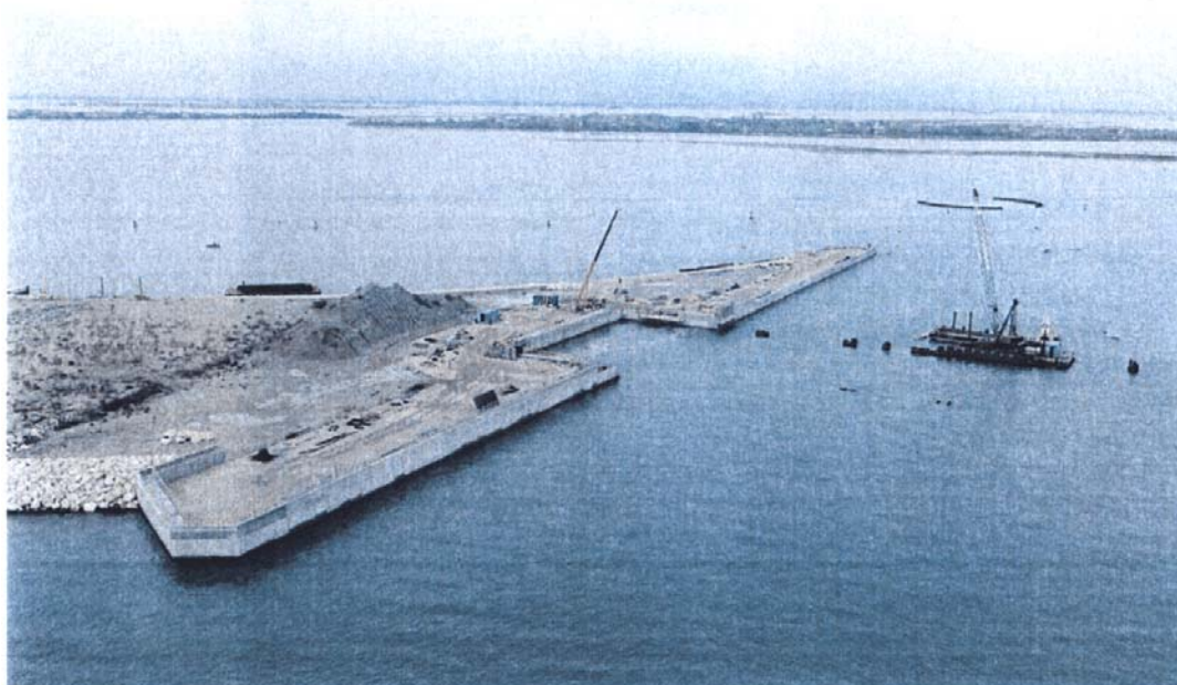
Bocca di Lido - Treporti: la spalla ovest di Treporti, vista dal lato mare.