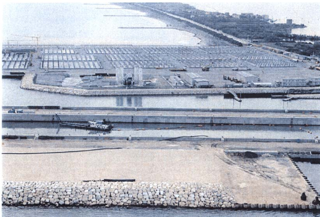
Bocca di Malamocco : dal basso il terrapieno della spalla sud, la conca di navigazione e il rilevato per la prefabbricazione dei cassoni con le piastre di appoggio in via di completamento.