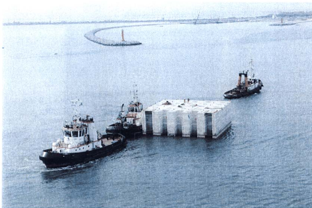
Bocca di Malamocco: fase di trasporto dei cassoni dell'impianto syncrolift.