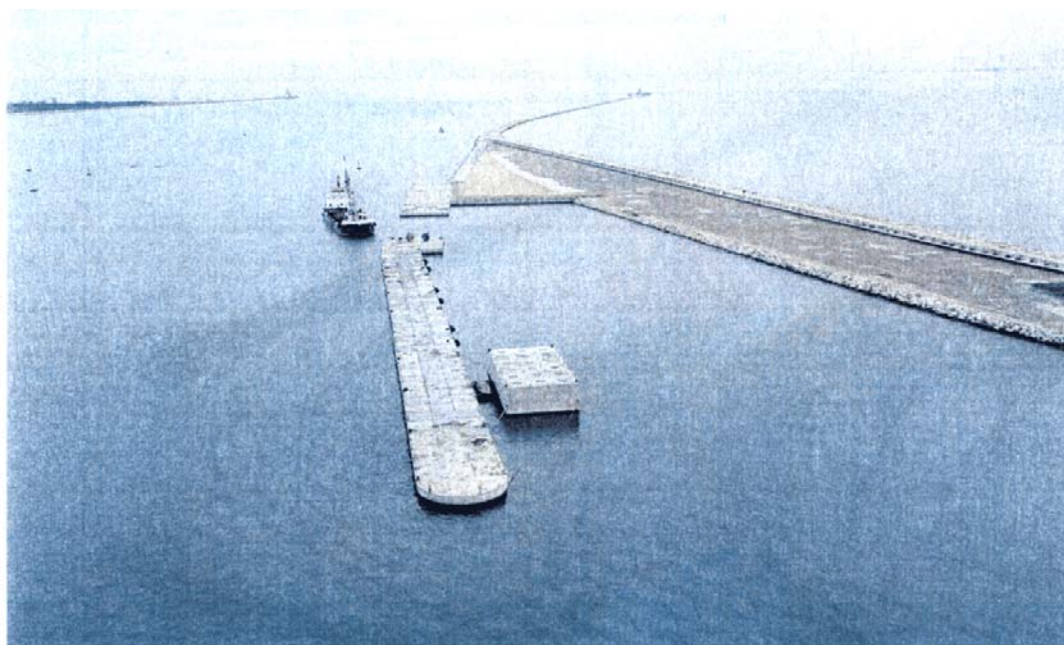
Bocca di Lido - S. Nicolò: I cassoni prefabbricati in calcestruzzo armato che costituiscono la struttura della spalla sud della barriera di S. Nicolò, già posizionati e zavorrati.