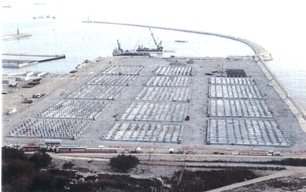
Bocca di Malamocco: cantiere, realizzato su un rilevato provvisorio, per la prefabbricazione dei cassoni di alloggiamento delle paratoie della barriera di S. Nicolò e di Malamocco: sono in costruzione le plastre ove poggieranno i cassoni durante la fase di prefabbricazione. Sullo sfondo la diga foranea.