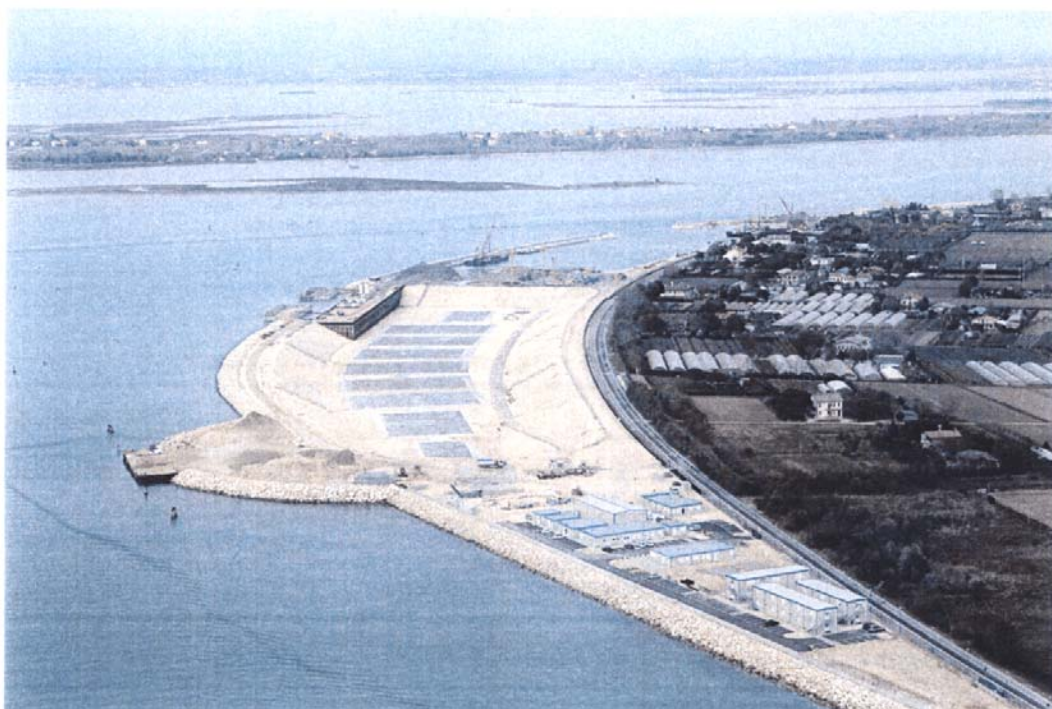
Bocca di Lido - Treporti: il porto rifugio lato mare, il cui bacino messo all'asciutto viene utilizzato come "tina" per la costruzione dei cassoni di alloggiamento delle paratoie e dei cassoni di spalla della barriera di Treporti. Si notano, ultimate, le piastre di appoggio per i casseri dei cassoni.