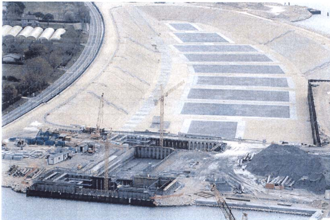
Bocca di Lido - Treporti: il porto rifugio lato mare, il cui bacino messo all'asciutto viene utilizzato come "tina" per la costruzione dei cassoni di alloggiamento delle paratoie e dei cassoni di spalla della barriera di Treporti. In primo piano la realizzazione della conca di navigazione.