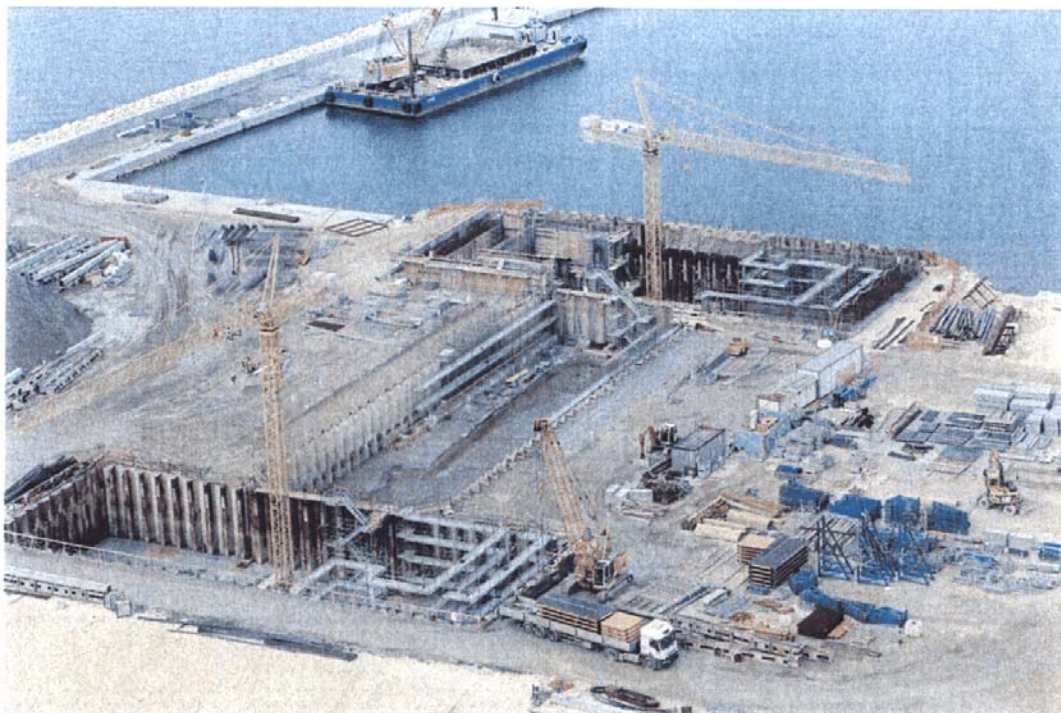
Bocca di Lido - Treporti : particolare delle lavorazioni per la realizzazione della conca di navigazione di Treporti.