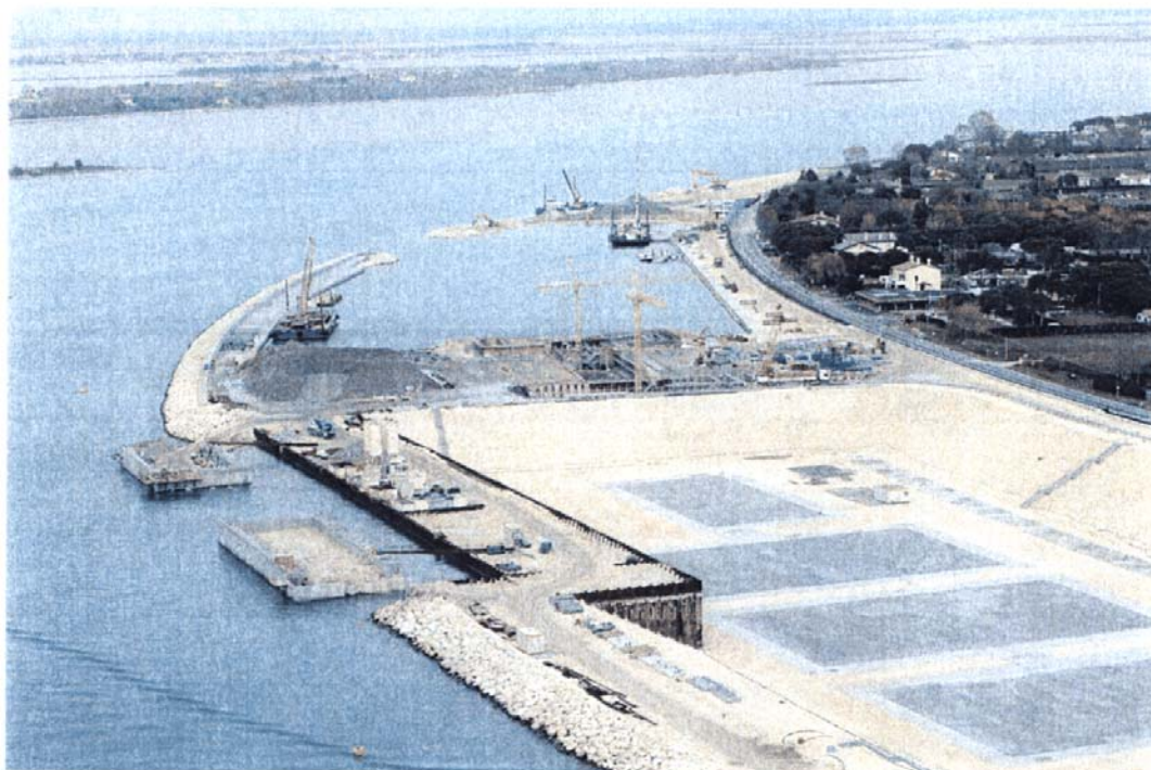
Bocca di Lido - Treporti : in primo piano la tura di prefabbricazione; più in là la conca di navigazione ed il porto rifugio lato laguna.