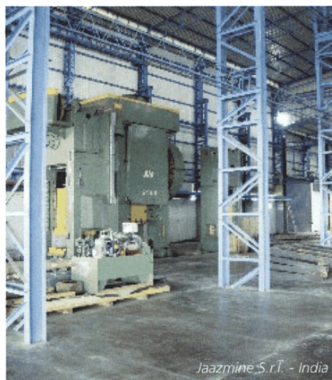
Jaazmine S.r.l. - India