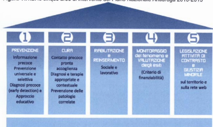
Figura VI.1.2: le cinque aree di intervento del Piano Nazionale Antidroga 2010-2013