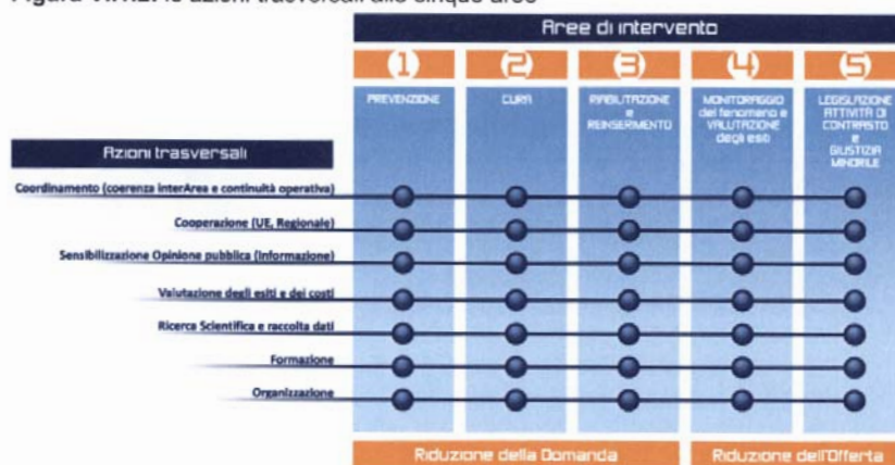
Figura VI.1.2: le azioni trasversali alle cinque aree

Così come contenuto nelle indicazioni europee, per ciascuna delle cinque aree sono previste una serie di azioni trasversali relative al coordinamento, alla cooperazione, alla sensibilizzazione dell'opinione pubblica, alla valutazione degli esiti e dei costi, alla ricerca scientifica e raccolta dei dati, alla formazione e all'organizzazione. Ognuna delle cinque aree di intervento prevede una serie di azioni trasversali relative al coordinamento, alla cooperazione, alla sensibilizzazione dell'opinione pubblica, alla valutazione degli esiti e dei costi, alla ricerca scientifica e raccolta dei dati, alla formazione e all'organizzazione, secondo lo schema seguente. Queste azioni trasversali rappresentano delle indicazioni di azione che andrebbero perseguite per ognuna delle aree di intervento al fine di migliorare l'efficacia generale del piano.