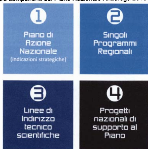
Figura VI.1.1: quattro componenti del Piano Nazionale Antidroga 2010-2013

L'insieme di queste quattro componenti costituirà il piano complessivo di azione che necessariamente, per poter essere efficace, deve prevedere l'esplicitazione delle strategie generali mediante l'elencazione degli obiettivi, delle azioni, delle organizzazioni deputate alla realizzazione e degli indicatori di esito, ma nel contempo dovranno seguire i singoli piani regionali con, per quanto possibile, una quantificazione delle risorse dedicate. Oltre a ciò, sono previste delle linee di indirizzo per le principali aree ed una serie di progetti nazionali a supporto del PAN che coinvolgeranno numerose unità operative.