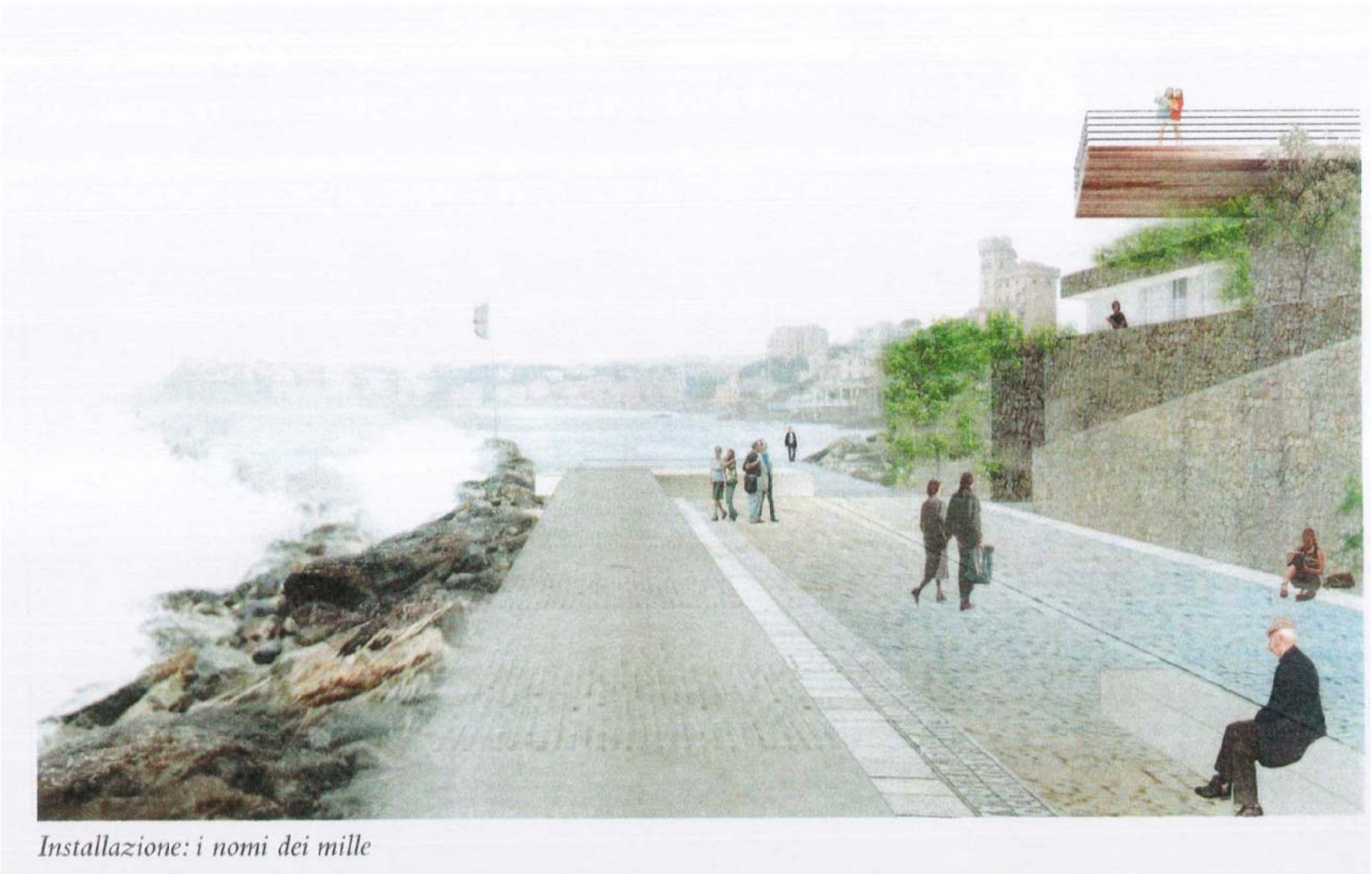
Installazione: i nomi dei mille