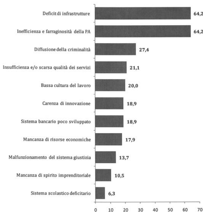
Fig. 4 - Cause principali dello svantaggio competitivo delle imprese del Sud rispetto a quelle del Nord (val. %)

Il totale è superiore a 100 perché erano possibili più risposte