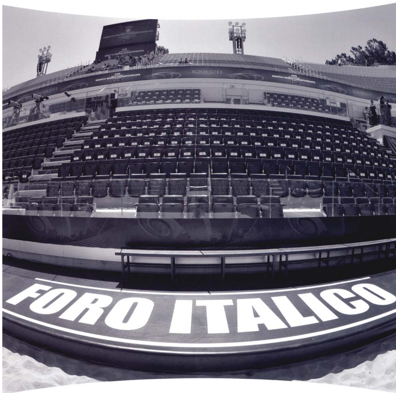
Parco Foro Italico, Roma. Beach Volley Swatch World Championship 2011.