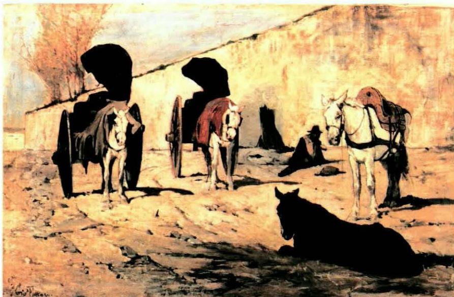
GIOVANNI FATTORI (Livorno 1825 - Firenze 1908) Riposi Palazzo Pitti, Galleria d'Arte Moderna