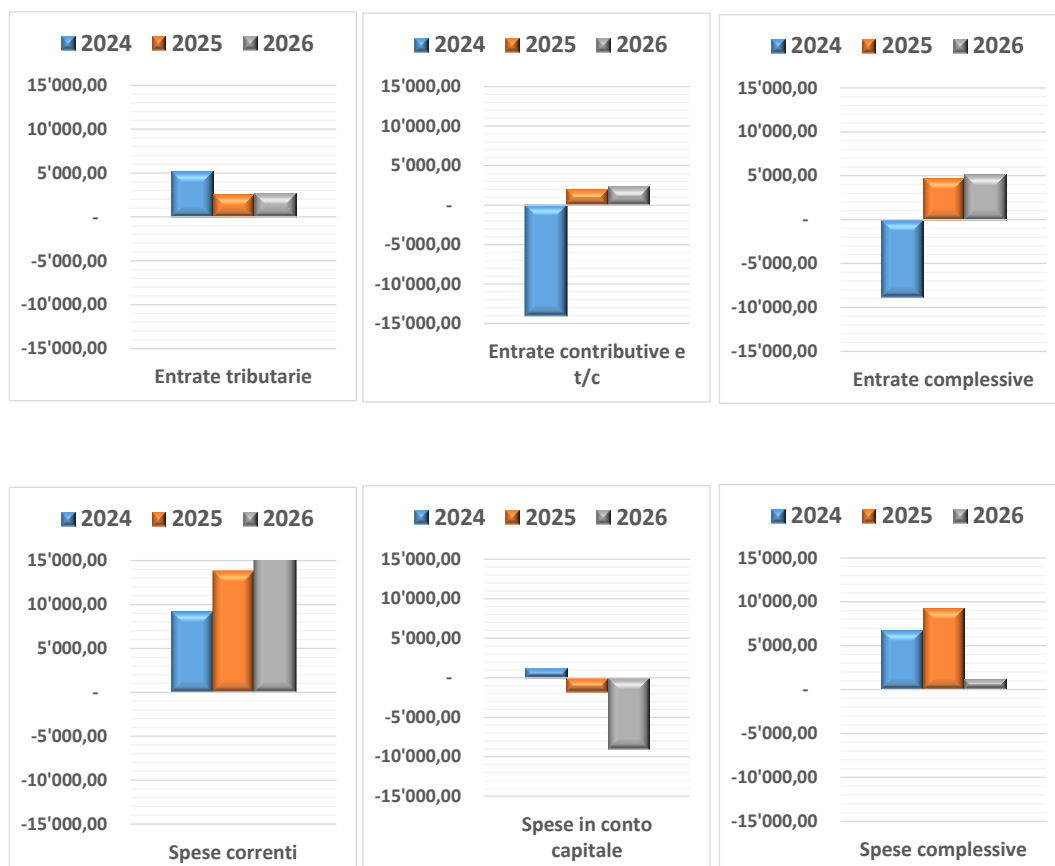
Figura 2 – Effetti netti della manovra sulle entrate e sulle spese (Impatto in termini di indebitamento netto)

Segno “-“ = effetto peggiorativo sull’indebitamento netto