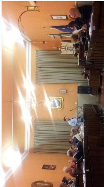
Es: Incontro con il Consiglio comunale di Stradella (PV)

C Organizzazione della Conferenza in scuole e università