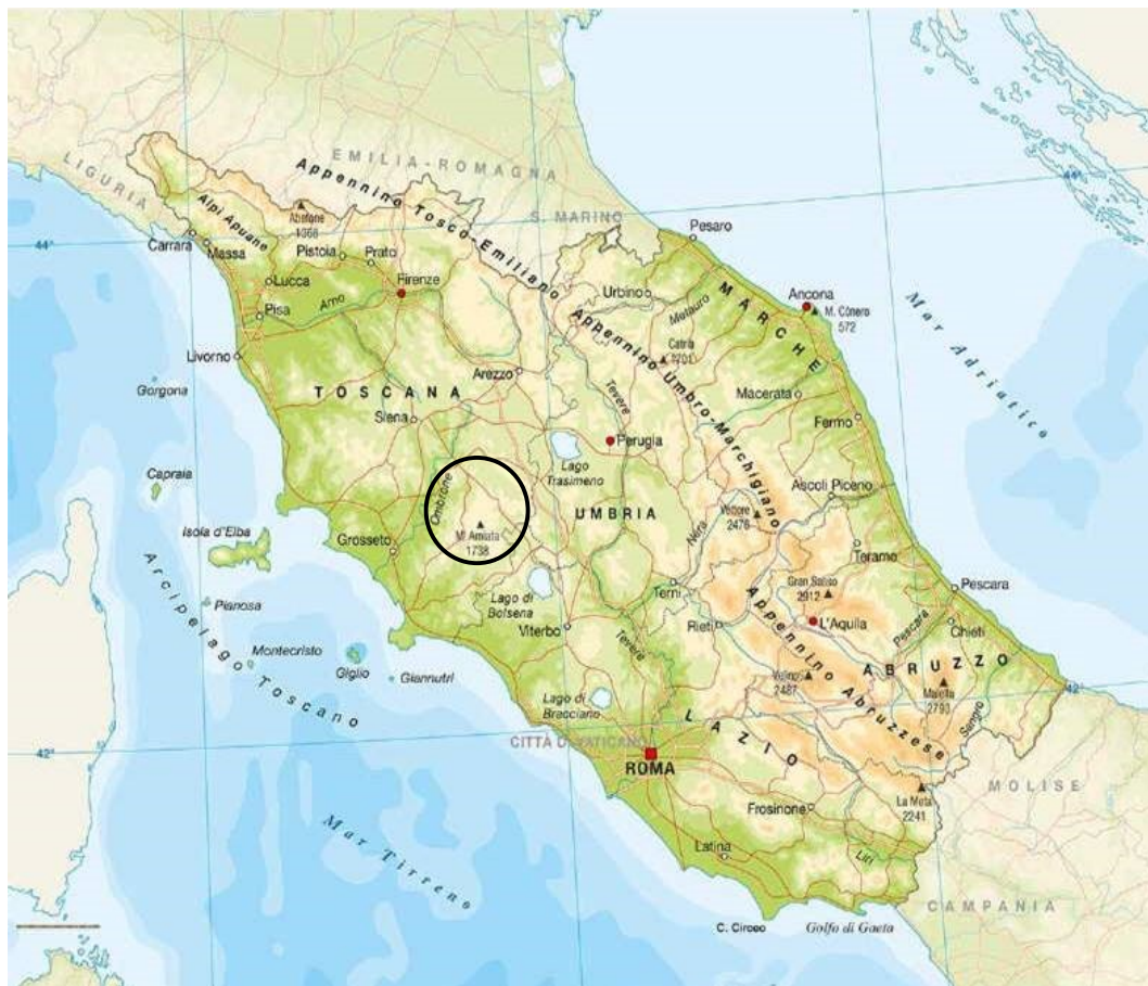
Fig. 3 - Estratto di carta fisica dell'Italia Centrale - Monte Amiata