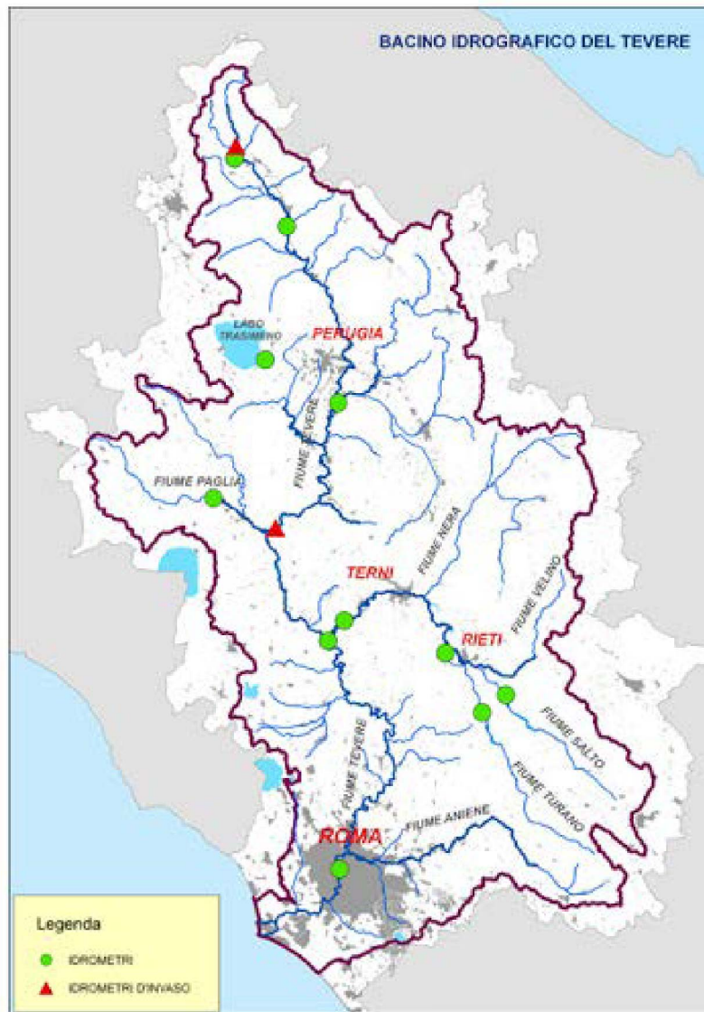
Fig. 2 - Bacino idrografico del Fiume Tevere in cui rientrano il fiume Paglia ed i suoi affluenti