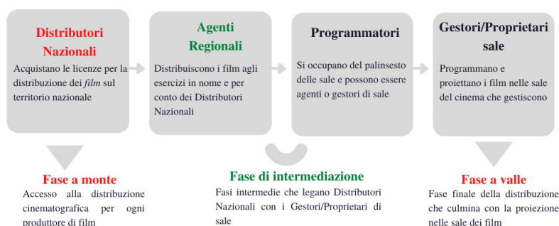
Figura 1. Filiera della distribuzione cinematografica

Tali fasi della filiera distributiva, dal punto di vista antitrust , costituiscono altrettanti mercati rilevanti, così come indicati nelle prassi dell'Autorità e della Commissione Europea: