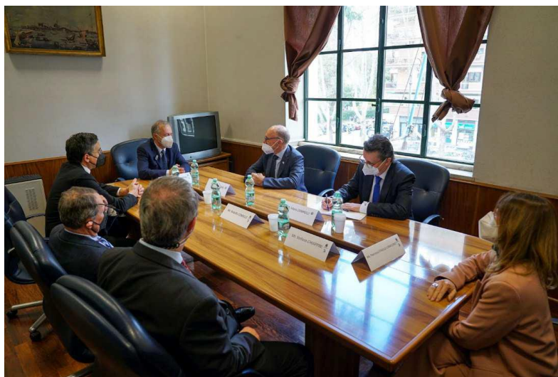
Visita del Segretario Esecutivo presso la sede dell'NDC italiano