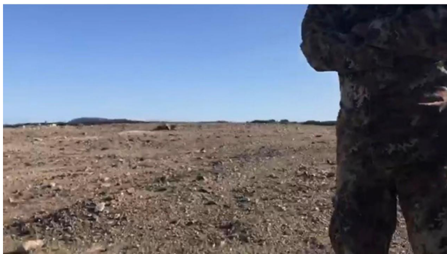
La distesa lunare di Zona Torri