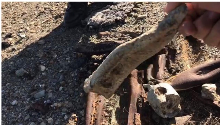
Residui delle esplosioni in zona Torri – si evince l’impatto delle altissime temperature sui metalli pesanti fatti esplodere