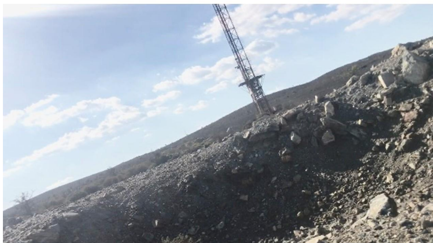
Zona Torri – PISQ – distesa di distruzione

I lavori di questa Commissione non possono lasciare niente di intentato per individuare i responsabili di chi ha considerato e trattato la Sardegna come una mega discarica incuranti della salute umana e non solo. Basta omissioni di Stato, occorre agire senza ulteriori indugi.