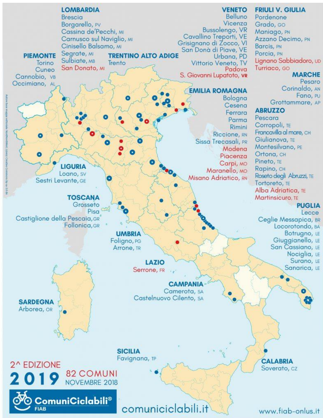
FIGURA 0.29: COMUNI ADERENTI ALL'INIZIATIVA "COMUNI CICLABILI"