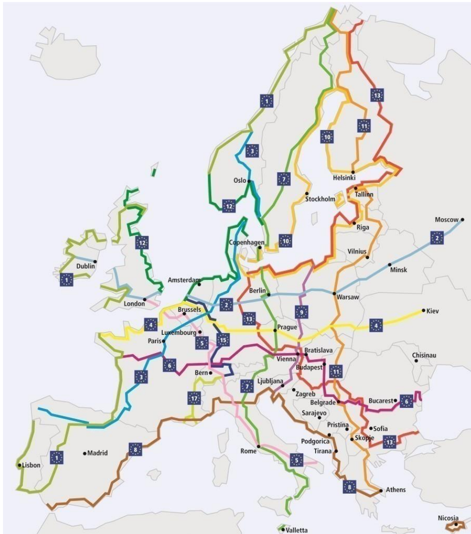
FIGURA 0.27: LA RETE DELLE CICLOVIE EUROPEE (EUROVELO)