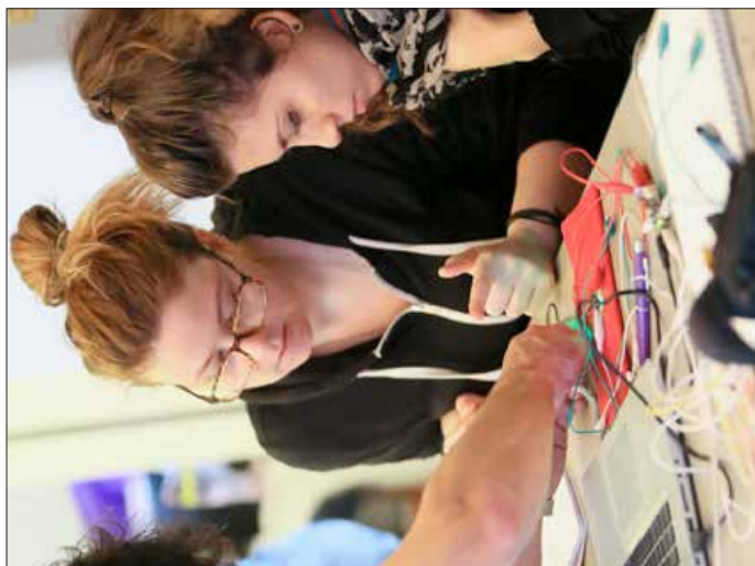
CORSO DI FORMAZIONE / MAKER

■ l'impegno - con nuovi strumenti che facilitano il dialogo diretto fra cittadini e comunità scientifica e la formazione dei ricercatori - nello sviluppo di cittadinanza scientifica e nella discussione critica di temi scientifici di interesse sociale;