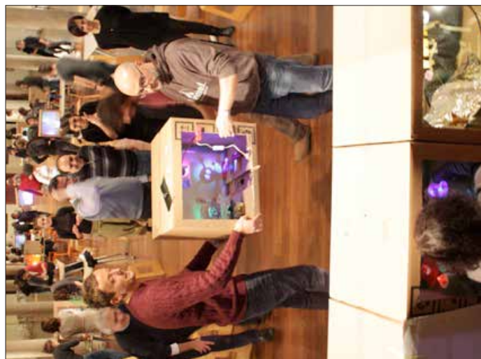
ATTIVITÀ LIGHT PLAY / STAFF